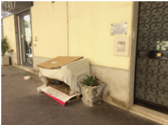
Lentini - Via Gramsci 13 ... quando la bontà non ha limiti.