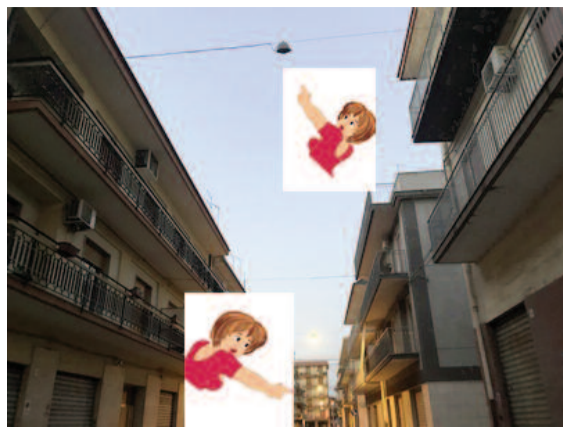
Lentini - Via Verga. Le mamme... lampada spenta da 5 anni!