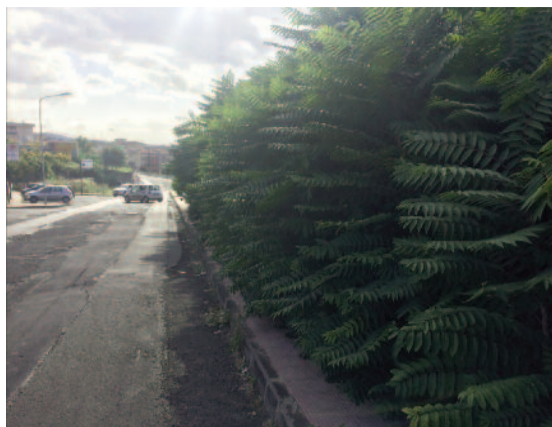
SANTUZZI -Pressi Ufficio Postale- La giungla che avanza.