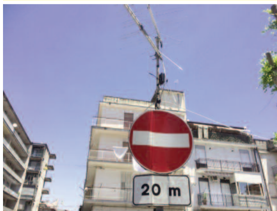
Lentini - Via Termini ... antenna in divieto di transito?